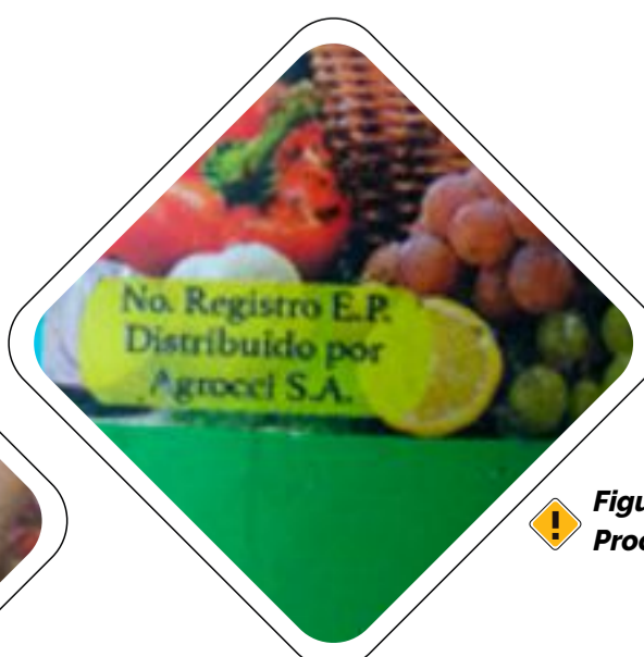
Figura 2. Etiqueta con Inscripción en Proceso o en Trámite.